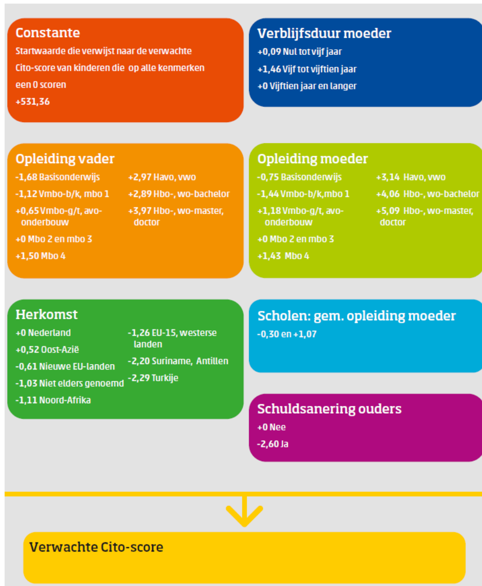
Figuur 1 CBS - berekening verwachte Cito-score

Het model is ontwikkeld door het CBS in opdracht van OCW. Deze gegevens zijn beschikbaar uit centrale registraties en worden, wanneer niet volledig, geschat.